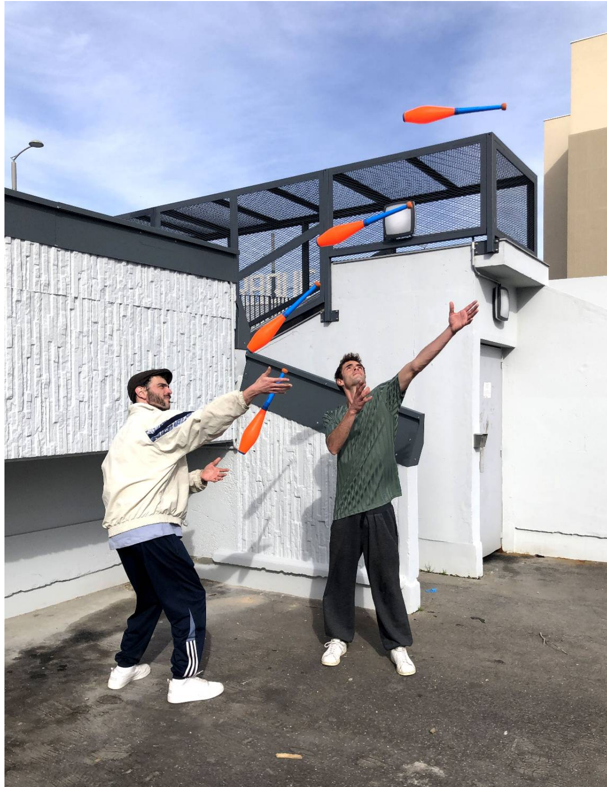
quartier Croix-du-Sud, Reims, 2024